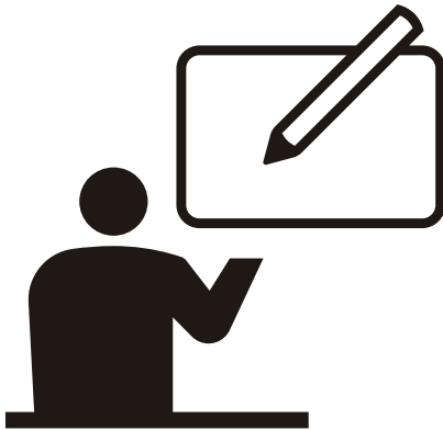
コミュニケーション:筆談対応