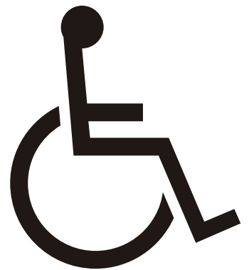
障害のある人が使える設備